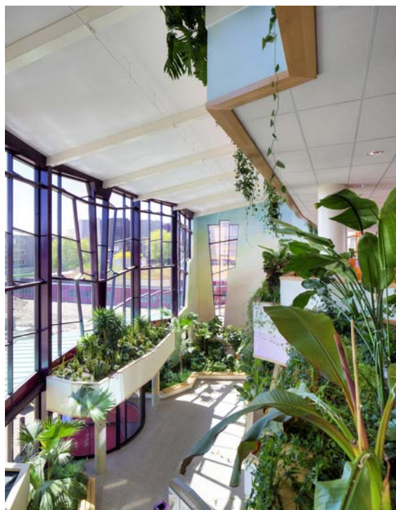
Ospedale "Isala" a Zwolle (NL)

Alberts & Van Huut International Architects in collaborazione con Aan de Amstel Architects